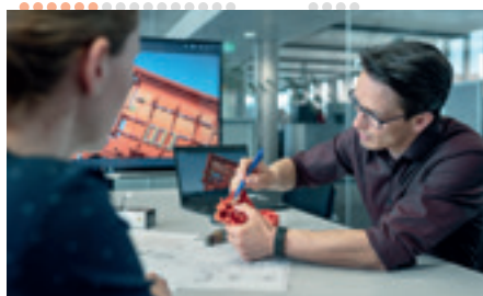
Da mucha importancia a las relaciones personales y al espacio para ideas innovadoras.

80 % «MADE IN GERMANY» EN LA SEDE DE LA EMPRESA