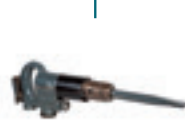
La máquina número 100.000 es un martillo FEIN