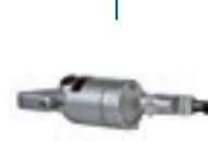
Sierra de calar para un trabajo en chapas más rápido para la industria automovilística