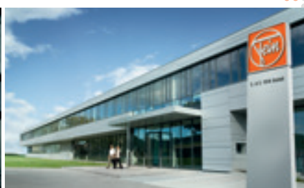
Empresa familiar global e independiente con raíces alemanas.