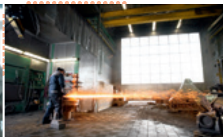
Adecuadas para los trabajos más duros en la industria y el uso profesional