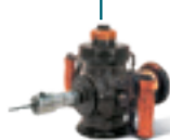
La primera herramienta eléctrica del mundo: el taladro FEIN