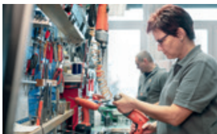
Ofrece múltiples soluciones de servicio relacionadas con sus productos.