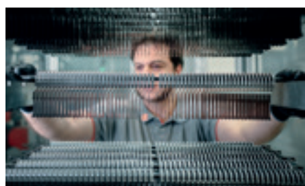
80 % «Made in Germany» con producción y desarrollo en Schwäbisch Gmünd.